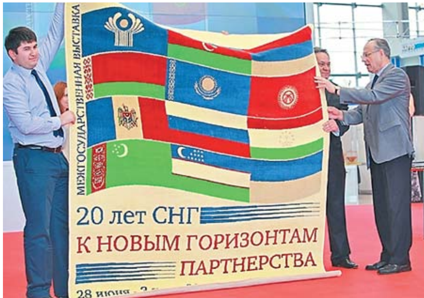
СТРАНЫ СНГ ОБЛАДАЮТ ВЫСОКИМ ИНВЕСТИЦИОННЫМ ПОТЕНЦИАЛОМ.