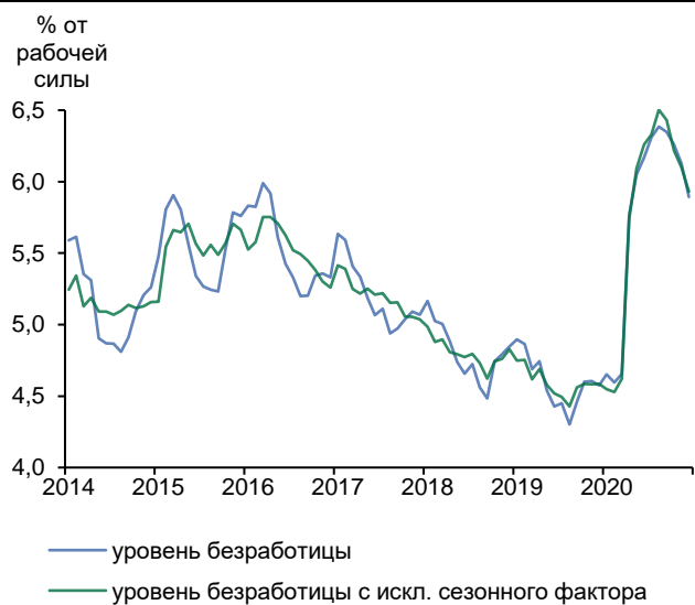
Рис. 3. Уровень безработицы снижается пятый месяц подряд