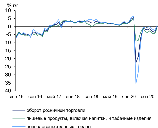
Рис. 1. Наблюдается восстановление потребительской активности